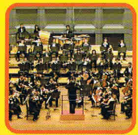
東京フィルハーモニー交響楽団