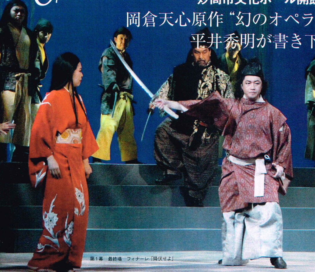
第1幕 最終場 フィナーレ「降伏せよ」

日本近代美術の父・岡倉天心の絶筆となった英文オペラ台本「白狐」は、1913年にポストンで執筆されたが、全幕完全版として作曲されることは無く、幻のオペラとされてきた。昨年12月、《妙高市文化ホール開館30周年記念事業》として、欧米でも活躍著しい指揮者の平井秀明に翻訳・台本・作曲が委嘱され、天心没後100年・生誕150年にあたる2013年12月1日、天心の終焉の地・妙高市にて世界初演が行われた。