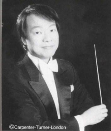
平井秀明 (作曲・台本・指揮) (HIDEAKI HIRAI)

1997年第6回フラデック・クラーク国際指揮者コンクール第1位。東フィル、新日フィルをはじめとする国内主要オーケストラを指揮するほか、2005年新国立劇場で歌劇「フィガロの結婚」を指揮。作曲家としても多くの作品を発表。ことにオペラ「かくや姫」は、国内はもとより豪州公演を成功させるなど、常に楽壇の注目を集めている。