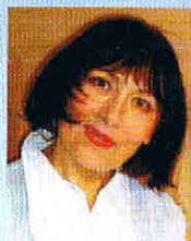
指揮/ルディガー・マイスター