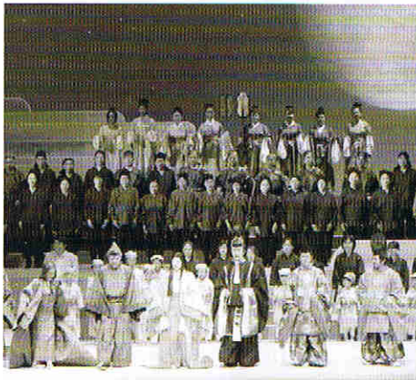
オペラ「かぐや姫」和光公演2006

ロシア・ナリチク音楽高校、アストラハン音楽院で声楽と指揮法を学ぶ。卒業後数年間後進の指導にあたった後、1995年からドイツを拠点に合唱指揮者として活躍。現在、パーデン・ヴェルテンベルク州都、シュトゥットガルトの5つの合唱団の常任指揮者を務める。マイスナー氏の類まれなる情熱的で音楽的な指導は、数々のアマチュア合唱団のレベルアップに成功、指揮者として高い評価を得る。これまでにドイツの他、フランス、イタリア、ロシア、ウクライナ等ヨーロッパ各地で合唱団を指揮。